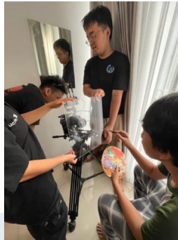
Gambar 3.4 Test cam di acrylic (Dokumentasi Pribadi)