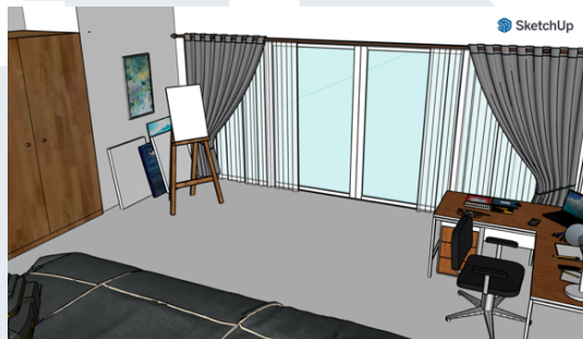
Gambar 3.3 Sketchup kamar Rafi