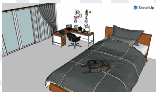
Gambar 3.1 Sketchup kamar Rafi